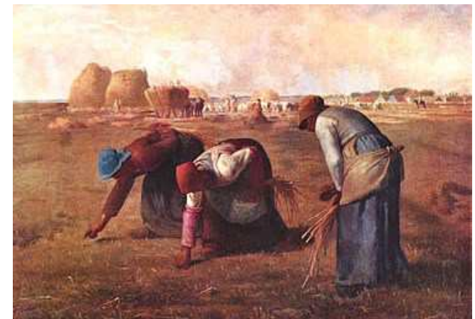
Las espigadoras (detalle), Jean François Millet

Atrevernos a ponernos en juego para buscar los motivos que en mí mismo, en el otro, o en la tarea concreta, me hacen descubrir un sentido mayor de mi trabajo y de mi vida.