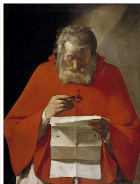
San Jerónimo, G. La Tour